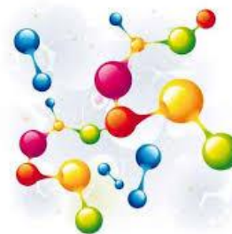
☠ Bromure de cyanogène (BrCN)

Le bromure de cyanogène est utilisé en chimie organique comme agent de déshydratation et dans la synthèse de peptides et de protéines.